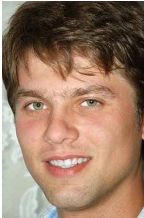
adhérent 3377 (Lyon)

Cette courte missive pour vous faire part de ma joie. En effet, depuis que j'ai commencé le niveau 2, je dois vous avouer que j'exprime un nouveau intérêt pour mes cours, et je suis très heureux d'y trouver des réponses aux questions que je me posais.