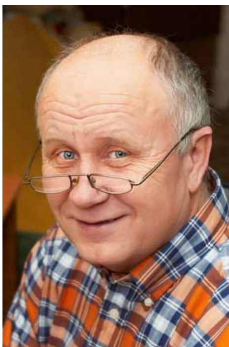
adhérent 1389 (Marseille)