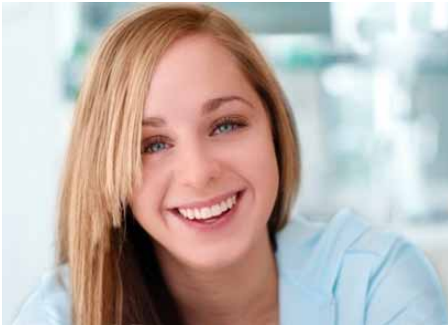
adhérent 1101 (Pézenas)

Je profite de l'envoi de ma cotisation pour vous faire part de ma gratitude qui ne saurait mieux s'exprimer que par une de vos formules : " Merci pour tout ce qui m'arrive ". Vous m'avez montré le chemin et je suis heureuse de l'avoir pris, de tenter l'aventure.