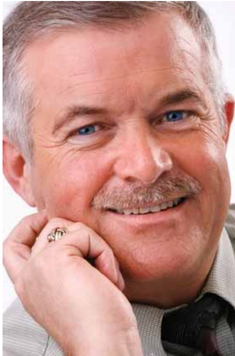
adhérent 2700 (Nice)

Je souhaite que tous les membres s'entraident toujours comme vous l'avez fait avec moi. Je vous remercie encore.