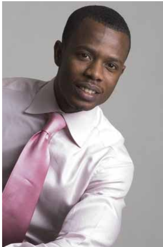
adhérent 1004 (Gabon)