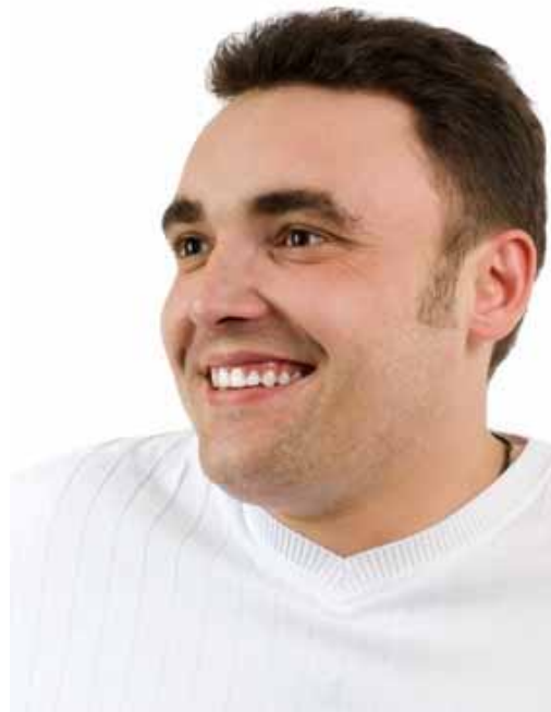
adhérent 464 (Bonchamp-les-Laval)

Pour moi il n'est pas question de laisser tomber mes cours, car votre enseignement et plus précisément son contenu est excellent.