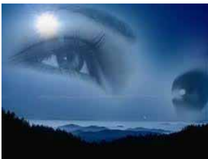
Vision à distance

Au fil de votre pratique, vous trouverez de nombreuses autres applications. Vous apprendrez à tirer profit de vos facultés ignorées et à révéler l'extraordinaire potentiel que recèle votre subconscient.